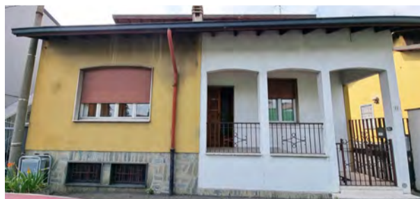
BRUGHERIO - via dei Mille

C. E. "G" - eph 264,56 Kwh/m 2 a Rif: 2941DZ