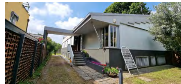
BRUGHERIO - via A. Stoppani - CENTRO

C. E. "G" - eph 370,76 Kwh/m 2 a Rif: 2893DZ