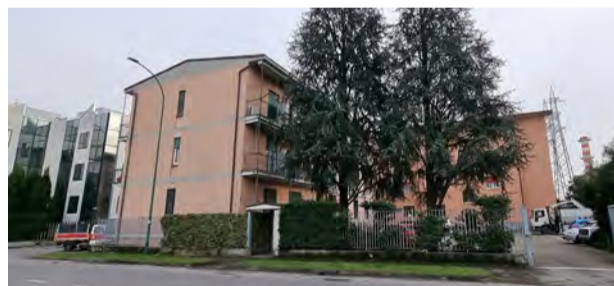
BRUGHERIO - via Volturmo

In contesto di palazzina di tre piani, al secondo piano, ampio 3 LOCALI con balcone. Libero subito. CANTINA e POSTO AUTO.