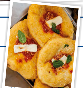
Montanarine napoletane assortite

Brugherio, Via Cazzaniga 2 • Aperti 8 - 20 / DOMENICA 8:30 - 13 f Bottega Santini Sigma Brugherio @bottega_santini1840