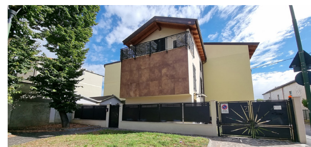
SESTO SAN GIOVANNI - via G. di Vittorio

C. E. "G" - eph 370,25 Kwh/m 2 a Rif: 2892DZ