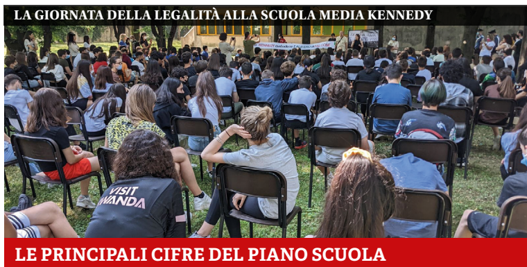
LE PRINCIPALI CIFRE DEL PIANO SCUOLA