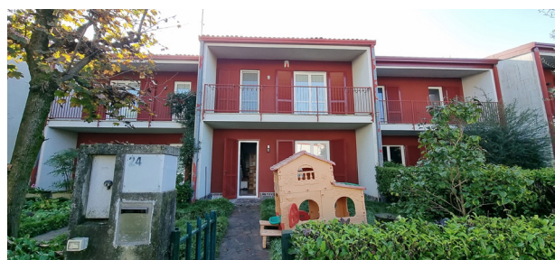
BRUGHERIO - via dei Mille

In elegante e riservato complesso residenziale costituito di sole ville, VILLETTA A SCHIERA con appartamento di 4 LOCALI disposto su due livelli. GIARDINO e CORTILE . Piano interrato con CANTINA e BOX .