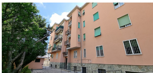
BRUGHERIO - via Cajani

C. E. "G" - eph 374,50 Kwh/m 2 a Rif: 2922DZ