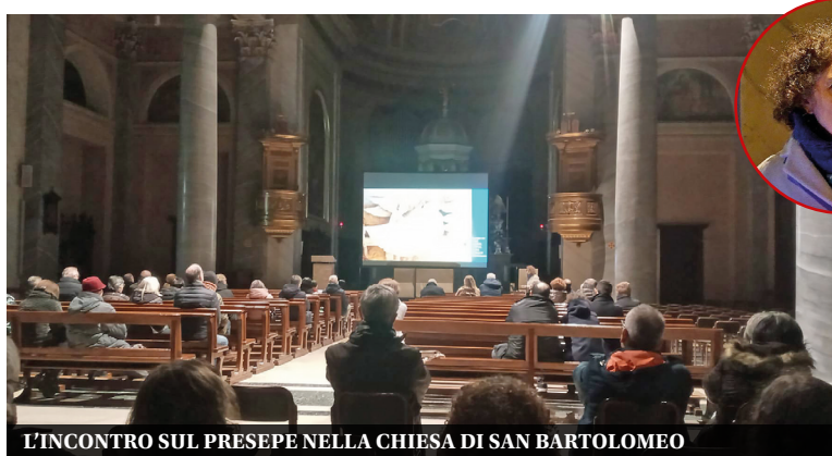
L'INCONTRO SUL PRESEPE NELLA CHIESA DI SAN BARTOLOMEO

Una approfondita lezione sulla nascita delle rappresentazioni delle immagini della Natività e sulla figura dei Re Magi, di questo si è parlato nella conferenza tenuta lo scorso lunedì 18 novembre in chiesa parrocchiale San Bartolomeo intitolata "Presepe a colori" organizzata dall'associazione Kairós e dalla comunità pastorale "Epifania del Signore", con il patrocinio dell'assessorato alle politiche culturali del Comune. A partire dalle incisioni dei primi cristiani presenti nelle catacombe romane, fino alle opere del primo novecento, come quella del pittore divisionista ferrarese Gaetano Previsti , la dotto-