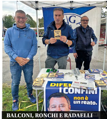
BALCONI, RONCHI E RADAELLI

anche porre l'accento sul mancato invito al tavolo in regione in cui si discute del doloroso tema delle morti bianche, come sono impropriamente chiamati i morti sul lavoro. Espri-