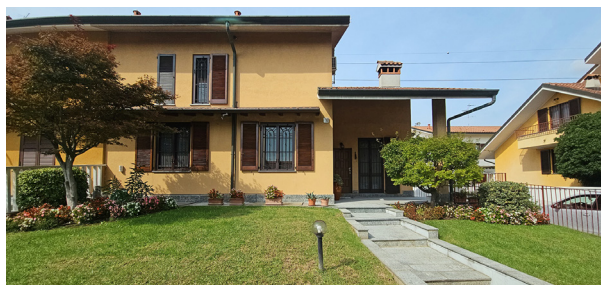
BRUGHERIO - via Moia

C. E. "F" - eph 236,72 Kwh/m 2 a Rif: 2905DZ