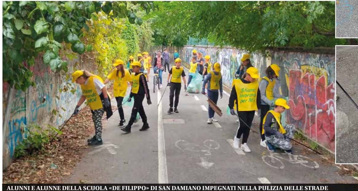
ALUNNI E ALUNNE DELLA SCUOLA «DE FILIPPO» DI SAN DAMIANO IMPEGNATI NELLA PULIZIA DELLE STRADE

Mozziconi di sigaretta, bottiglie di vetro e di plastica, pacchetti vuoti di patatine; sono solo alcuni dei rifiuti trovati e raccolti dai ragazzi tra siepi e marciapiedi. Muniti di guanti, pinze, cappelli e pettorina, i giovani volontari della De Filippo si sono divisi in piccoli gruppi, ognuno con il proprio sacco. Hanno recuperato circa 6kg di vetro e quasi 4kg di plastica; notevole anche la quantità di