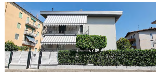
BRUGHERIO - via Cajani

C. E. "G" - eph 370,76 Kwh/m 2 a Rif: 2902DZ