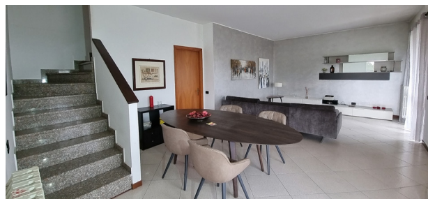
BRUGHERIO - viale Lombardia

In contesto semi-indipendente, in palazzina di sole due unità, APPARTAMENTO al primo piano disposto su due livelli. Area ad uso esclusivo al piano terra. BOX DOPPIO.