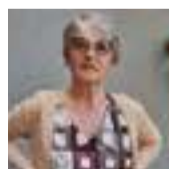
Castelli Maria Assunta San Bartolomeo