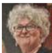
Desio Livia Rosa Santa Maria Nascente