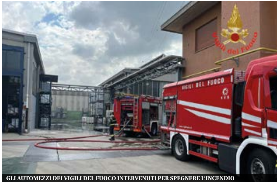
GLI AUTOMEZZI DEI VIGILI DEL FUOCO INTERVENUTI PER SPEGNERE L'INCENDIO