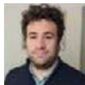
Magni Filippo San Bartolomeo