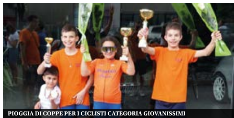
PIOGGIA DI COPPE PER I CICLISTI CATEGORIA GIOVANISSIMI

Tornando alle gare, da segnalare la più convincente prova di tutto il team Esordienti, com-