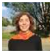
Beretta Emanuela Santa Maria Nascente