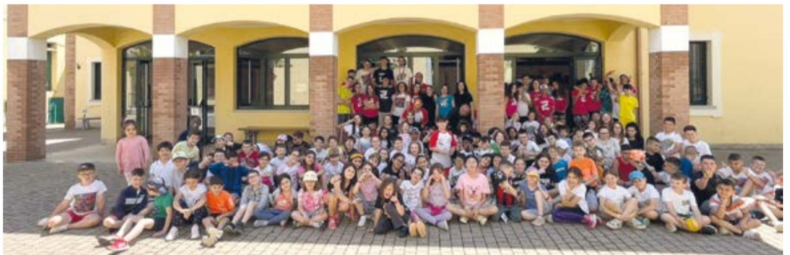
DALL'ALTO AL BASSO I RAGAZZI DELLE PARROCCHIE