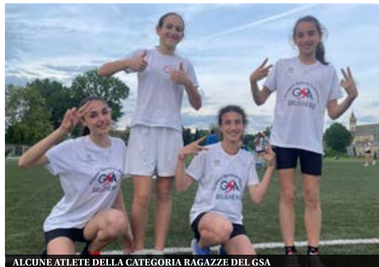
ALCUNE ATLETE DELLA CATEGORIA RAGAZZE DEL GSA