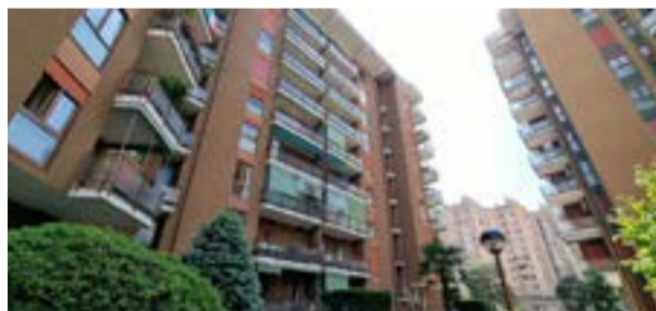
COLOGNO M.SE - via J.F. Kennedy

C. E. "D" - eph 83,28 Kwh/m 2 a Rif: 2860DZ