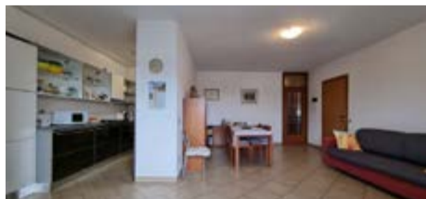
COLOGNO M.SE - via Einaudi

Vicino alla metro M2, 3 LOCALI al decimo piano con vista panoramica. Contesto condominiale oggetto di riqualificazione e con servizio di portineria diurno. CANTINA.