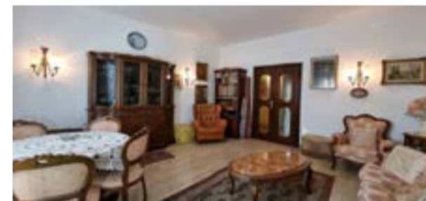
COLOGNO M.SE - via Piemonte

C. E. "G" - eph 329,54 Kwh/m 2 a Rif: 2884DZ