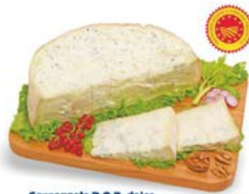
Gorgonzola D.O.P. dolce