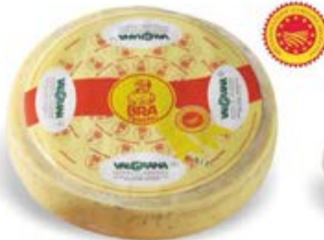
Bra Tenero D.O.P. Vaigrana