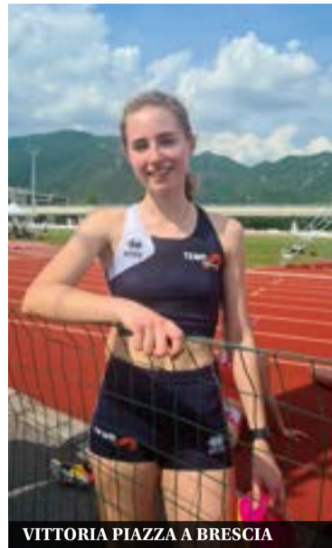
VITTORIA PIAZZA A BRESCIA

Quindi si passa a Bressanone, in provincia di Bolzano, dove si è