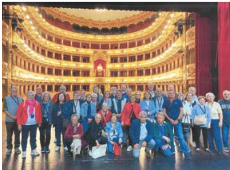
Gli Amici del '54 sul Palco del Teatro Ponchielli di Cremona Per la loro Festa