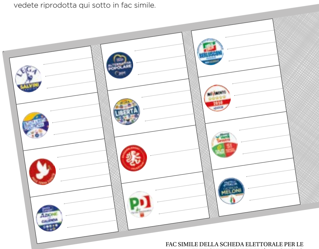
FAC SIMILE DELLA SCHEDA ELETTORALE PER LE ELEZIONI EUROPEE DELL'8 E 9 GIUGNO

Si vota mettendo una X sul simbolo del partito preferito. Chi vuole, può anche scrivere, accanto, il nome di un candidato di quello stesso partito. Se ne possono votare fino a 3, facendo attenzione che siano di sesso diverso: due donne e un uomo o viceversa. Se se ne votano due, devono essere un uomo e una donna. Per votare servono tessera elettorale e un documento d'identità.