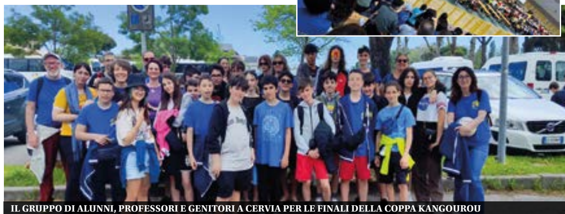
IL GRUPPO DI ALUNNI, PROFESSORI E GENITORI A CERVIA PER LE FINALI DELLA COPPA KANGOUROU

I brugheresi hanno fatto una gara di rincorsa: 67° nella clas-