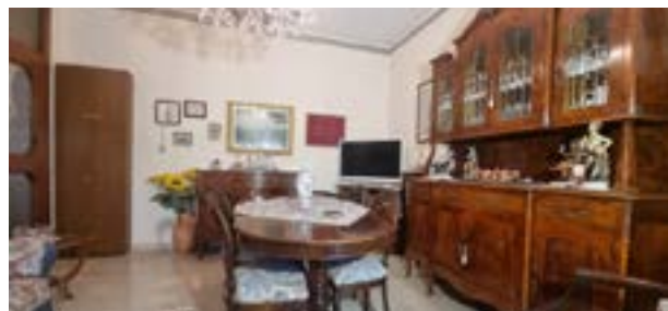
BRUGHERIO - via Don Milani

Appartamento di 3 LOCALI in piccola palazzina di 4 unità. Ampio SOTTOTETTO di 82 mq sovrastante l'alloggio, completamente rifinito. BOX DOPPIO e POSTO AUTO.