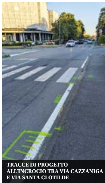
TRACCE DI PROGETTO ALL'INCROCIO TRA VIA CAZZANIGA E VIA SANTA CLOTILDE