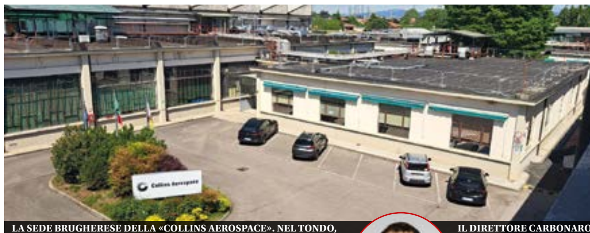
LA SEDE BRUGHERESE DELLA «COLLINS AEROSPACE». NEL TONDO,

L'acquisizione da parte di Mi- crotecnica, una legal entity di Collins Aerospace, avviene nel 2001. Il business delle macchine industriali era già stato dismes- so da tempo e l'attività Aerospa- ce è stata spostata nel sito di Brugherio.