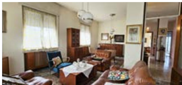
BRUGHERIO - via Marsala

C. E. "G" - eph 255,83 Kwh/m 2 a Rif: 2723DZ