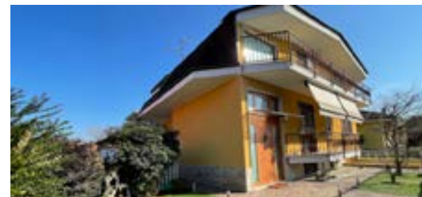
BRUGHERIO - via Sciesa

C. E. "G" - eph 287,48 Kwh/m 2 a Rif: 2836DZ