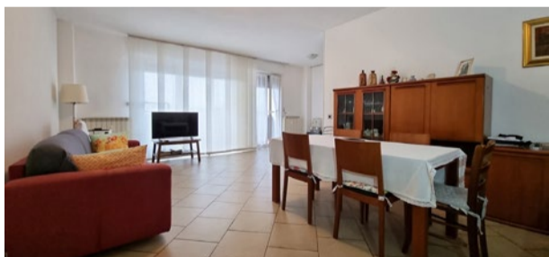
COLOGNO M.SE - via Einaudi

Vicino alla metro M2, 3 LOCALI al decimo piano con vista panoramica. Contesto condominiale oggetto di riqualificazione e con servizio di portineria diurno. CANTINA.