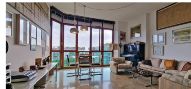
BRUGHERIO - via Volturmo - Edilnord

C. E. "G" - eph 255,20 Kwh/m 2 a Rif: 2845DZ