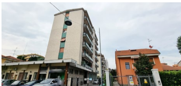
BRUGHERIO - via Oberdan

C. E. "D" - eph 83,28 Kwh/m 2 a Rif: 2860DZ