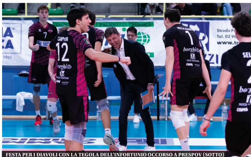
FESTA PER I DIAVOLI CON LA TEGOLA DELL'INFORTUNIO OCCORSO A PRESPOV (SOTTO)

Il match è stato molto equilibrato, gli ospiti hanno venduto carissima la pelle iniziando il primo secondo e terzo set con