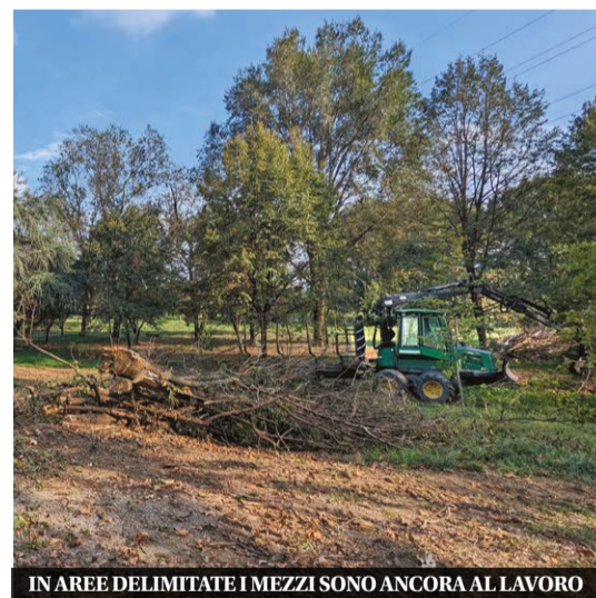
IN AREE DELIMITATE I MEZZI SONO ANCORA AL LAVORO