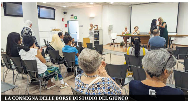
LA CONSEGNA DELLE BORSE DI STUDIO DEL GIUNCO

Ricordiamo inoltre che da diversi anni la Caritas, sostiene anche l'aiuto con materiale per la prima Infanzia, da 0 a 3 anni, a diverse famiglie in grave difficoltà economica. Tale aiuto si avvale in buona parte del contributo del Centro Aiuto alla Vita di Brugherio.