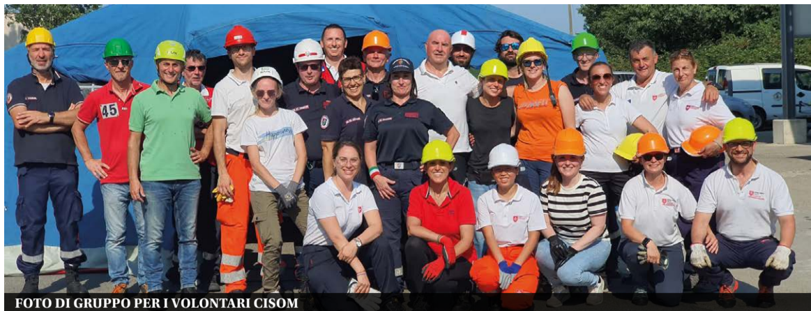
FOTO DI GRUPPO PER I VOLONTARI CISOM