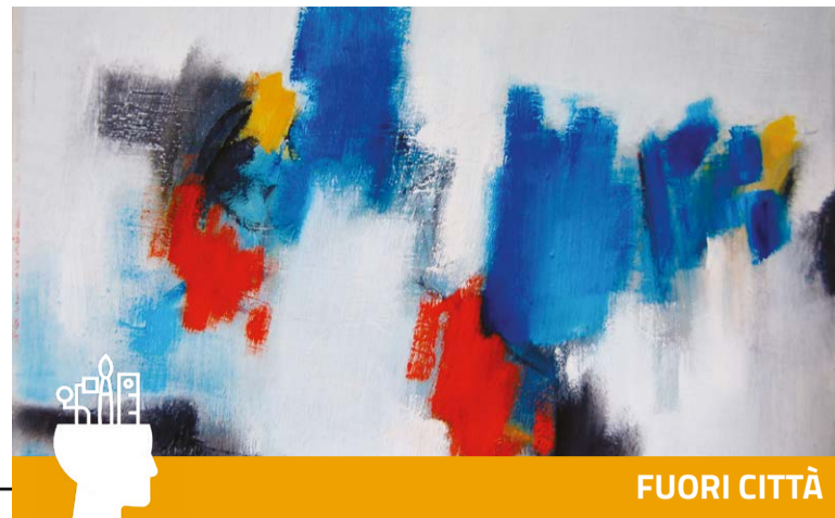
GIOVANNI TERUZZI, "MACCHIE NERE, ROSSE E BLU", 2004. COLLEZIONE COMUNE DI BRUGHERIO