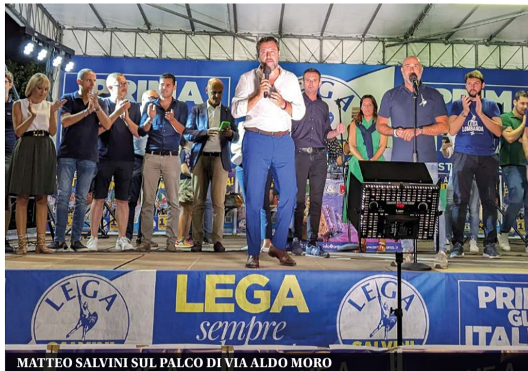
MATTEO SALVINI SUL PALCO DI VIA ALDO MORO

L'attacco è con l'aumento degli stipendi e delle pensioni, da finanziare anche con il risparmio sul Reddito di cittadinanza e con la tassa sui cosiddetti extraprofiti delle banche. Vale a dire, semplifica Salvini stesso, «quando la Banca centrale europea aumentava il costo del denaro, le banche sono state molto veloci ad aumentare il costo dei soldi a chi li chiedeva in prestito, ma non altrettanto veloci ad aumentare gli interessi su chi ha il conto corrente in banca». E poi