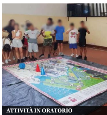
ATTIVITÀ IN ORATORIO

volontari residenti in Lombardia che hanno frequentato il 19° Corso Base A1; gli addestramenti hanno riguardato l'antincendio, il montaggio della tenda, l'illuminotecnica, l'uso dell'idrovora e quello delle radio; il 18 luglio, presso l'oratorio San Giuseppe, si è svolto un incontro con i ragazzi del centro estivo, per parlare di buone pratiche di protezione civile e i cambiamenti climatici». I volontari hanno proposto agli oltre 50 ragazzi