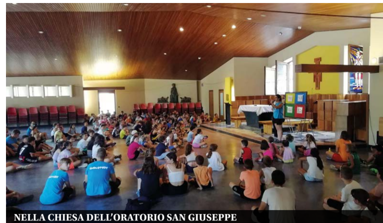
NELLA CHIESA DELL'ORATORIO SAN GIUSEPPE

Attività nei parchi, in piazza Roma e anche con i ragazzi dei centri estivi