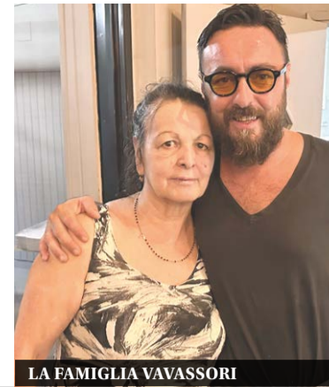
LA FAMIGLIA VAVASSORI