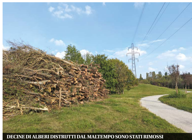
DECINE DI ALBERI DISTRUTTI DAL MALTEMPO SONO STATI RIMOSI

15 VILLE APERTE Nella manifestazione che fa riscoprire la nostra città quest'anno c'è anche la passeggiata notturna