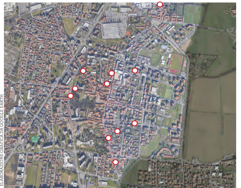
ELABORAZIONE GRAFICA DA GOOGLE EARTH

8 Istituzione del senso unico in via Santa Margherita, nel tratto tra via degli Artigiani e via Bassi, con unica direzione consentita in direzione di via San Francesco d'Assisi, con istituzione di stalli di sosta senza limitazione oraria.