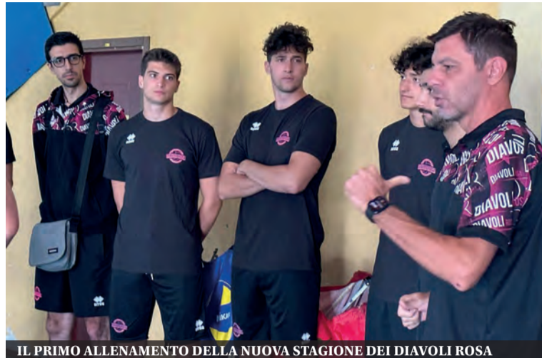
IL PRIMO ALLENAMENTO DELLA NUOVA STAGIONE DEI DIAVOLI ROSA