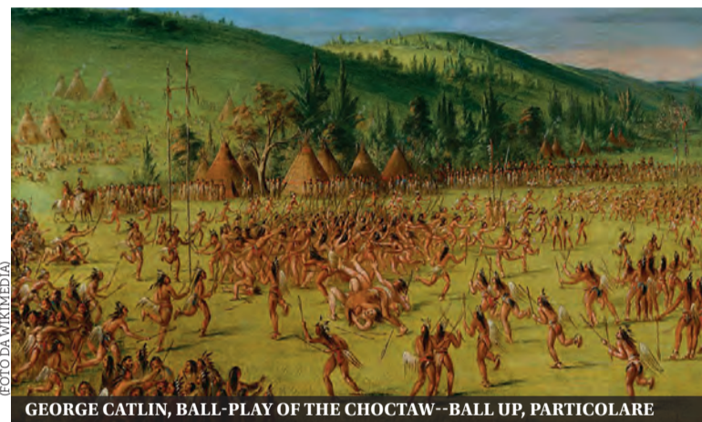
GEORGE CATLIN, BALL-PLAY OF THE CHOCTAW - BALL UP, PARTICOLARE

San Diego, Usa, 1 luglio 2023. Si è da poco concluso il campionato mondiale di lacrosse, in cui la nazionale italiana ha fatto una bella figura, piazzandosi al nono posto, su una trentina di squadre partecipanti. Raggiungendo gli ottavi di finale, la squadra ha ottenuto il suo miglior risultato in una competizione mondiale. Il lacrosse è uno sport in cui due squadre si fronteggiano, con una decina di giocatori da una parte e altrettanti dall'altra usando una racchetta triangolare con una reticella in cima. Lo scopo è quello di fare gol nella piccola porta avversaria: alta, quanto larga, poco meno di due metri. In pratica, questa disciplina può essere definita una sorta di "hockey estivo". Ed è veramente un peccato che in Italia sia ancora poco conosciuto, anche se in lenta diffusione. Ma quello che oggi per primo stupisce è che le origini di questo sport, sono state raccontate da un nostro connazionale. Il sorprendente aeronauta ed esploratore Paolo Andreani , nel corso del suo viaggio in terra americana, non ha di certo