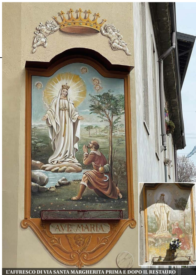
L'AFFRESCO DI VIA SANTA MARGHERITA PRIMA E DOPO IL RESTAURO