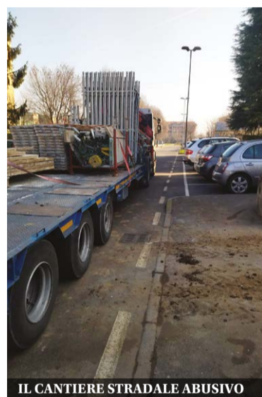
IL CANTIERE STRADALE ABUSIVO

persona portata in ospedale in codice verde. Anche lunedì 30 gennaio un tamponamento a catena ha coinvolto tre veicoli. E sempre in viale Lombardia, all'altezza del civico 288, senza feriti gravi.