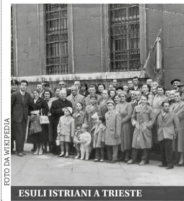
ESULI ISTRIANI A TRIESTE

alcolemico ha dato un valore leggermente sopra il limite di 0,5 g/L: il doppio test ha infatti dato come risultati 0,67 e 0,68 g/L. All'uomo è stata ritirata la patente di guida, tolti 10 punti dalla patente e sanzionato per 543 euro.