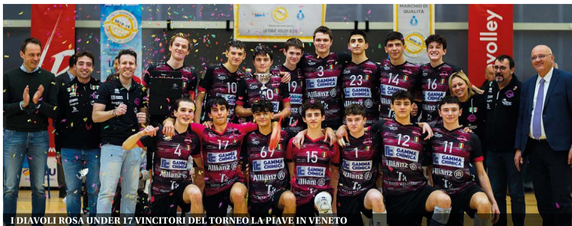
I DIAVOLI ROSA UNDER 17 VINCITORI DEL TORNEO LA PIAVE IN VENETO